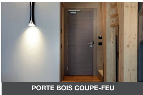
PORTE BOIS COUPE-FEU