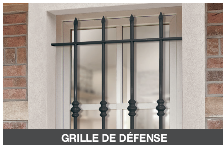
GRILLE DE DÉFENSE