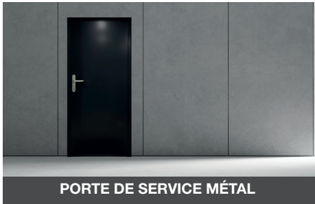
PORTE DE SERVICE MÉTAL