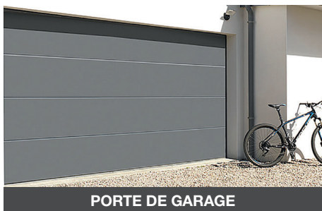
PORTE DE GARAGE