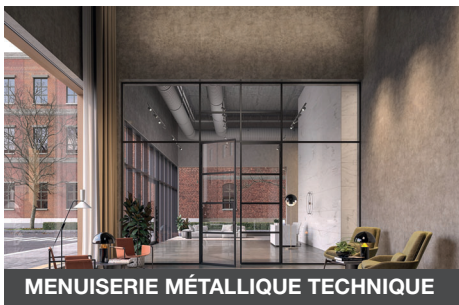
MENUISERIE MÉTALLIQUE TECHNIQUE