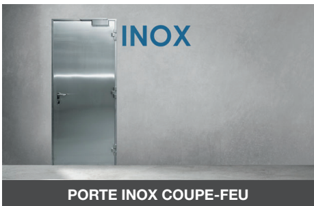
PORTE INOX COUPE-FEU