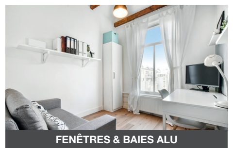
FENÊTRES & BAIES ALU