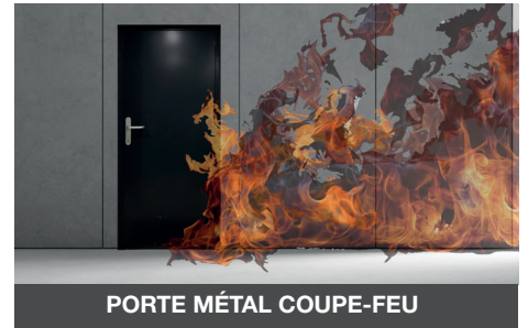
PORTE MÉTAL COUPE-FEU