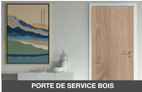
PORTE DE SERVICE BOIS